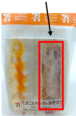
商品画像（正）海老カツ