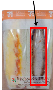
商品画像（誤）とんかつ